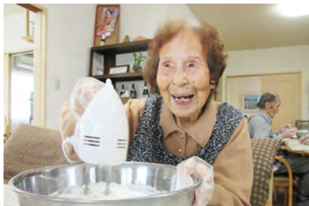
手作りの食事やおやつ