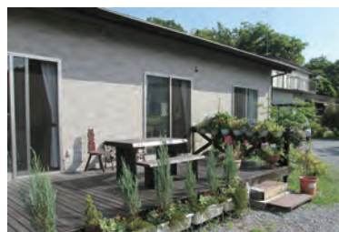
広々としたテラスで お茶をすることもできます