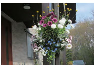
花のある玄関でお出迎え