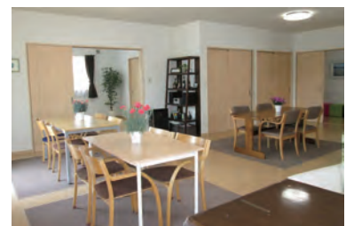
一体感の生まれるリビング