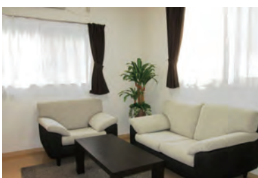
プライバシーに配慮した相談室