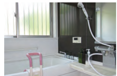
清潔感のある浴室