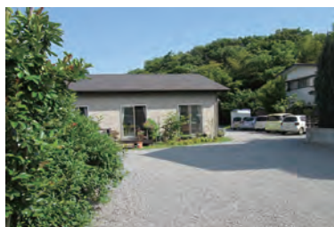
緑に囲まれた一戸建ての施設