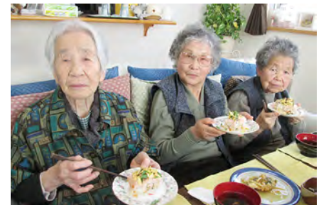
楽しいと思える空間

一般的に定められているスタッフの数より多い人数を配置しているので細かな部分までサービスが行き届きます。