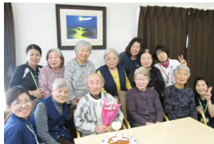
充実したスタッフの数

一般的に定められているスタッフの数より多い人数を配置しているので細かな部分までサービスが行き届きます。