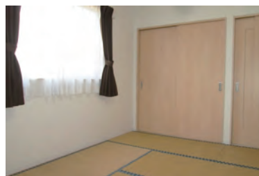
くつろぐことのできる和室