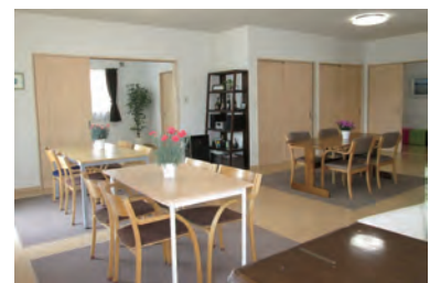
一体感の生まれるリビング